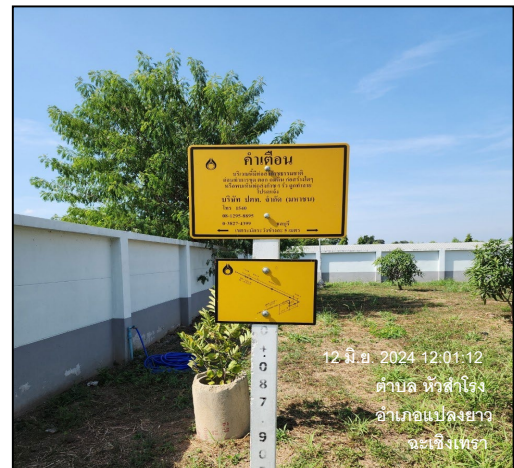
ป้ายเตือนแนวท่อส่งก๊าซธรรมชาติ