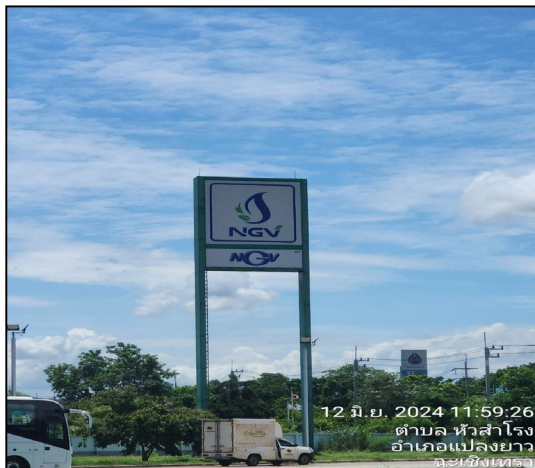
ป้ายแสดงสถานี