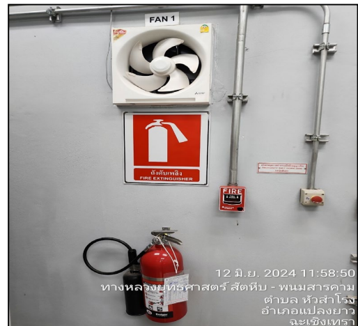
ถังดับเพลิง

ภาพที่ 3.2-3 ภาพถ่ายแนวเส้นทางท่อและการติดตั้งป้ายเตือนแนวท่อส่งก๊าซธรรมชาติไปยัง โครงการท่อส่งก๊าซธรรมชาติสำหรับยานยนต์ สถานีบริการก๊าซธรรมชาติ หจก. แปลงยาวเอเนอร์ยี